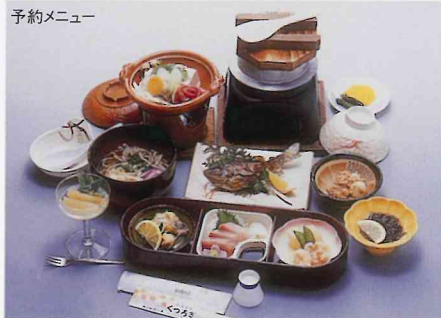
4,650円コース(入浴料含む)