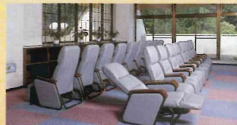
休憩室(リクライニングシート)

◆泉質 フッ素、メタボ酸などを 含んだアルカリ性単純泉 露天風呂 大浴場 ジェットバス バイアラス 寝湯 ヨモギを主とした薬湯 うたせ湯 ボディシャワー 低温塩サウナ