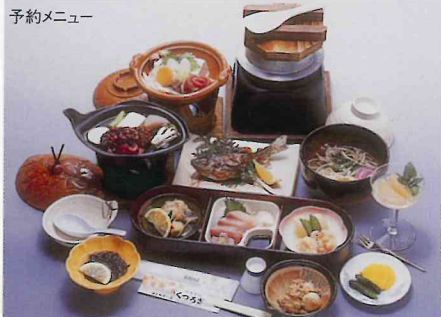
5,700円コース(入浴料含む)